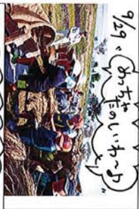
9/9、おちいはいわーお、こわがてうかばーお、たまるはてい!!

秋空の下、おんぱカを合わせて米刈りをしました。おのこめでの子が99、いい体験ができました。