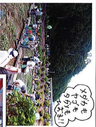
メダカもウガメもたくさんいます!!