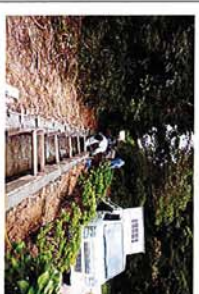
～水路補修中(高上ダ)～

立梅用水のかんがい期間が"終了した9月から来年の3月までの間地域の方と一緒に施設の補修にやりかかります。 9月は雨も多々思うようには現場が"動きませんが"一つも多くの施設を補修が"できるように取り組んでいきたいと思います"。