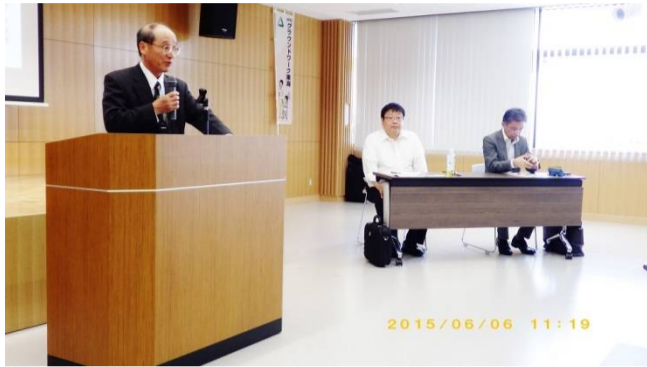
写真は理事長挨拶と東海農政局、中部地方整備局来賓

6月6日(土)11:00~12:00 明治用水会館(愛知県安城市大東町22-16)において、出席会員数18名、委任状提出者数12名、合計30名の出席で以下の議題について審議し、全て承認されました。総会資料はグラウンドワーク東海ホームページに掲載しています。