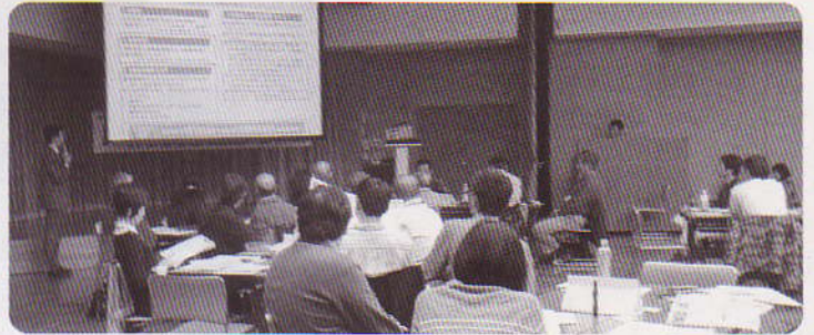
セミナー会場風景(2014年)